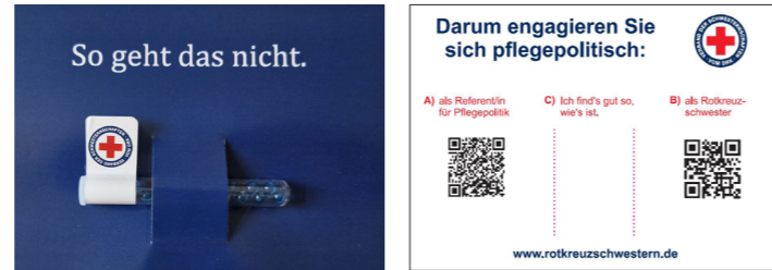
Coffee2Go-Becher und Postkarte (Vorder- und Rückseite) mit klarem Appell.

Teilnehmenden zu mehr berufspolitischem Engagement aufzurufen.